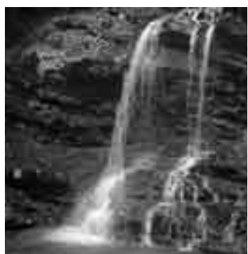
～清浄の滝(大滝)～ 涼を求めて出かけてみませんか？