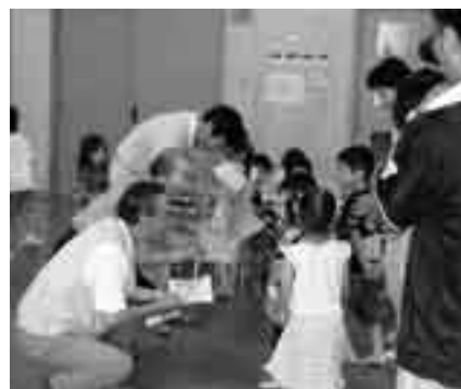
「はたけ先生」にお礼の 絵が贈られました

おいしそうに食べていました。花の木保育所の児童からは、当日の体験の様子を描いた絵が「はたけ先生」にお礼として贈られました。 児童たちは、来年のじゃがいも植え、収穫を今から楽しみにしています。