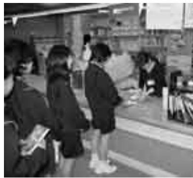
皆さんに気持ち良く利用していただける図書館を目指します

開館時間の延長については、費用対効果の面からも検討しながら、市民の皆さんがより利用しやすい運営体制を研究していきます。