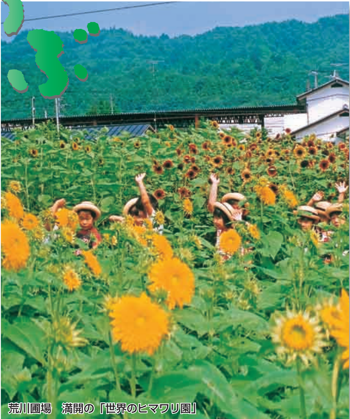
荒川園場 満開の「世界のヒマワリ園」

【世帯数】 26,133世帯 前月比-12世帯 平成17年7月1日現在 (人口・世帯数は 外国人登録を含む)