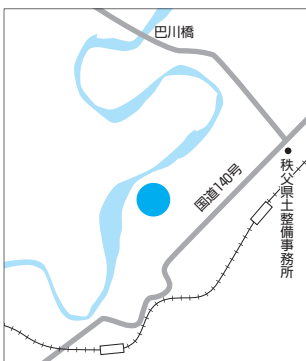
9月2日(金) 秩父市総合防災訓練会場 (影森グラウンドおよび河川敷)