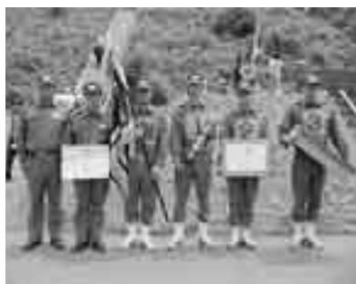
入賞された消防団の皆さん