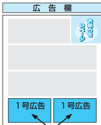
ここにります。 2号広告は1段全面にります。