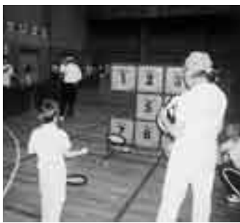
ゲーム感覚で誰でも気軽に参加できます。

内容 各種スポーツ団体・レクリエーション団体による演舞や、市民参加の体験コーナー、一般・団体対抗種目、フリーマーケットの開催などの他、豪華景品が当たる抽選会もあります。(詳細は市報ちちぶ9月号でお知らせします。)