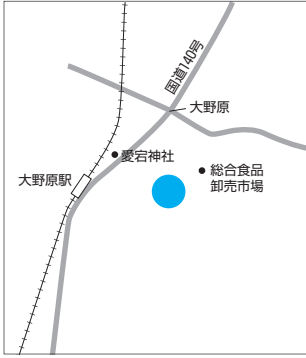
8月21日(日) 秩父市大規模集団災害訓練会場 (大野原 南山粘土跡地)

当日、訓練会場近くにお住まいの方などは、サイレンを吹鳴しますので、実際の事故・災害とお問