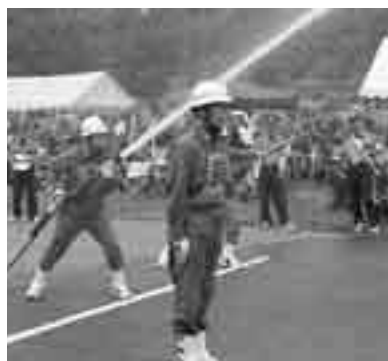
日ごろの訓練の成果を競い合いました